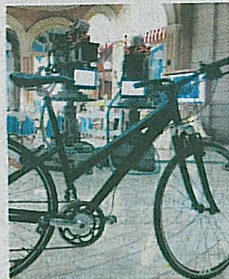
La bicicletta brevettata

Questo sistema sarà anche di grande supporto per la medicina. Grazie alla collaborazione